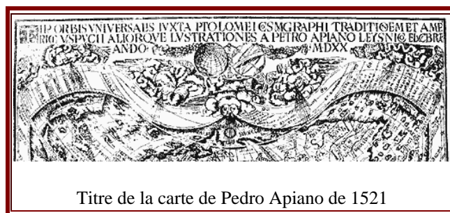
Titre de la carte de Pedro Apiano de 1521

Les terres mentionnées ne figurent pas sur la vignette de la carte de Waldseemüller dans laquelle Vespucci apparaît avec sa carte, elles ne figurent pas non plus sur la carte de Pedro Apiano de 1521 où il est écrit dans le titre qu'elle a été faite avec les cartes de Tolomeo et de Vespucci.