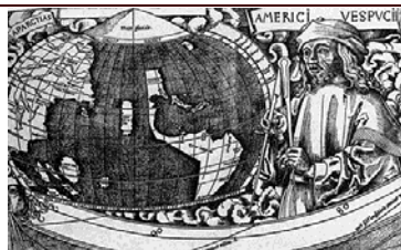
Vignette de la carte de Waldseemüller de 1506, Amerigo Vespucci avec sa carte

Le personnage en question n'a jamais parcouru ni découvert l'Amérique Centrale, l'Isthme de Panama et l'Océan Pacifique.